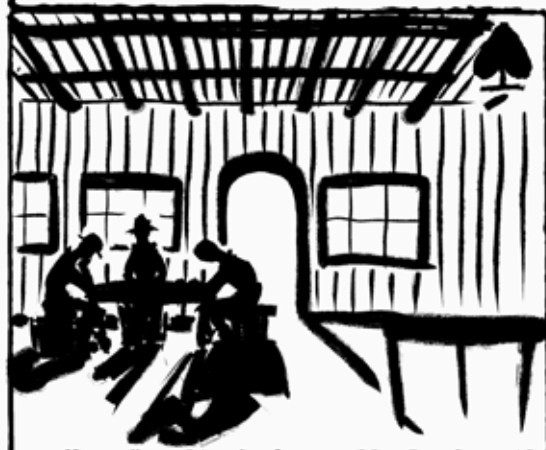
Sede del Sindacato

Non c'è molto da fare nelle Sands, e il Rattlesnake è uno dei pochi posti in cui si ritrova la gente. Se lavori per la LUCKY4U, fai meglio a starne alla larga.