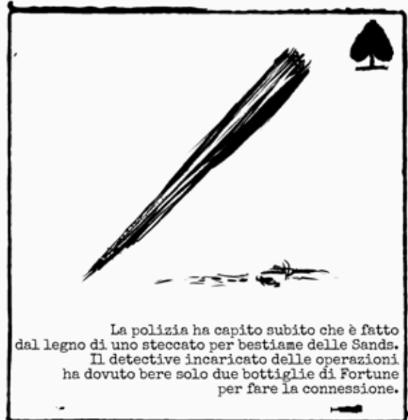
Paletto nel petto di Al

Fissate la vittima al centro della bacheca. Gli altri due indizi sono la scena del crimine e un oggetto trovato sul posto. Fissateli vicino ai rispettivi quartieri. Tenete questi indizi di partenza separati dagli altri indizi.