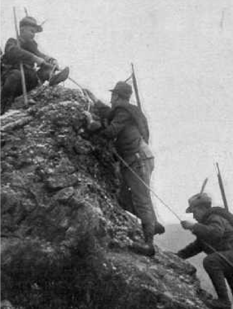
1914 soldati italiani in montagna

Il 28 giugno 1914 l’assassinio di Francesco Ferdinando a Sarajevo diede inizio alla Prima Guerra Mondiale. L’Italia, che faceva parte della Triplice Alleanza insieme a Germania e Austria-Ungheria, subito si dichiarò neutrale, ma l’anno successivo fu protagonista di una svolta clamorosa. Infatti, attratta dalla promessa di acquisire Trentino, Alto Adige, Venezia Giulia e Istria (territori che avrebbero finalmente completato l’unità d’Italia), il nostro Regno uscì dalla Triplice Alleanza, si schierò con la Triplice Intesa (Inghilterra, Francia e Russia), e il 24 maggio 1915 dichiarò guerra all’ex-alleata Austria-Ungheria.