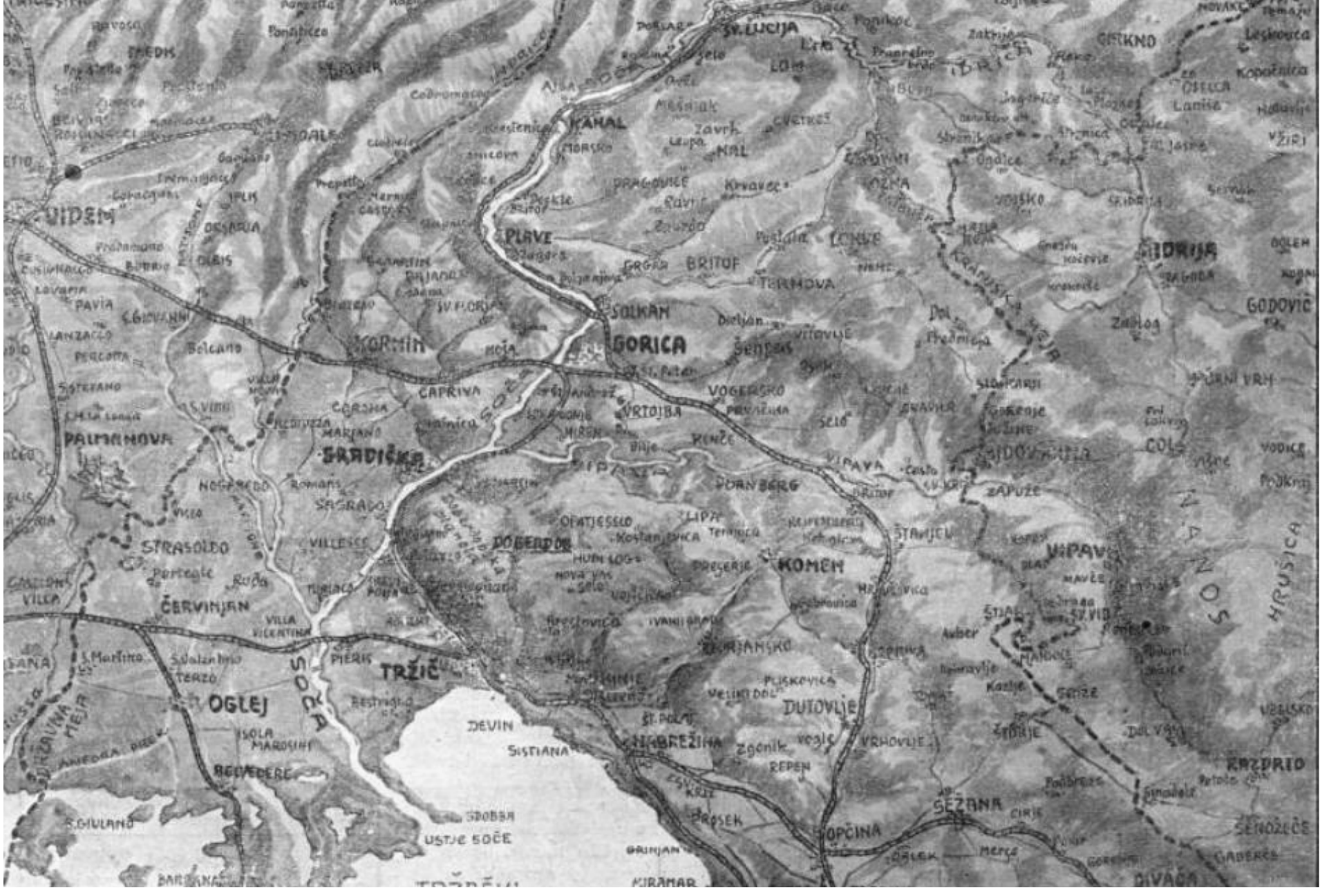
Mappa del fronte dell’Isonzo

Questo Micromondo si concentra sul fronte italiano orientale subito dopo l’entrata in guerra del Regno d’Italia. Rispetto all’esercito austro-ungarico, quello italiano aveva meno uomini, un addestramento inferiore e armamenti peggiori. L’unica speranza di vittoria era quella di attaccare subito, all’improvviso, in un’area non troppo montuosa come la Venezia Giulia, sperando che la guerra durasse poco. Nei primissimi giorni di guerra l’esercito italiano conquistò un’area geografica relativamente ampia tra Udine e Trieste. L’esercito austro-ungarico, però, dopo un primo arretramento iniziò a resistere e trasformò l’avanzata italiana in una sanguinosa guerra di trincea sui monti del Carso, durata tre lunghissimi anni.