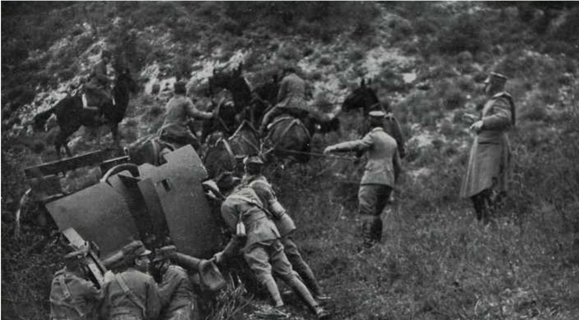
1915 alpini italiani sul fronte austriaco

I territori della Venezia Giulia conquistati dal Regio Esercito Italiano nella primavera del 1915 erano ricchi di conflitti da sfruttare per giocare storie intense e appassionanti: 🏳️ Italia e Austria-Ungheria passarono da alleate a nemiche in guerra nel giro di pochissimo tempo (una ventina di giorni). Nei territori di confine molti abitanti si trovarono loro malgrado schierati contro persone che fino a tre settimane prima erano amici o addirittura parenti. 🏳️ Non tutti gli abitanti della Venezia Giulia volevano essere annessi al Regno d’Italia. Infatti, molti erano tedeschi o slavi (quindi non si sentivano italiani), oppure avrebbero sofferto danni economici a seguito dell’annessione (ad esempio Trieste, che diventando italiana avrebbe perso il vantaggio di essere l’unico sbocco austro-ungarico sul Mediterraneo, inoltre avrebbe dovuto affrontare la concorrenza di Venezia, Genova, Napoli e Taranto). 🏳️ L’esercito italiano era in netta inferiorità rispetto a quello austro-ungari-